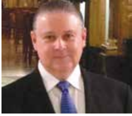
Por Roberto J. Argüello

Chairman Northern Media Group y Vida y Éxito rjarguello@ceoadvisors.us